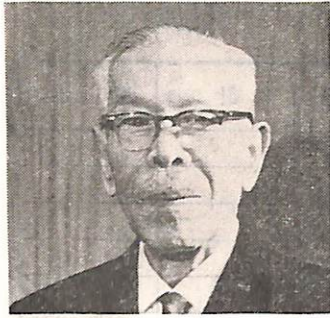
大谷 武一 おお たに ぶ いち

明治20年5月14日 兵庫県に生れる 大正2年 東京高師文科兼体操専修科卒業 " 6年 体育研究のため2カ年米留学 昭和2年 ラジオ体操第一を創案 " 5年 全日本体操連盟(現日本体操協会)創設 副会長 " 7年 第10回オリンピック大会体操チーム総監督 " 24年 東京教育大学教授 " 25年 日本体育学会創立 理事長 " 東京教育大学体育学部長 日本体育協会会賓 " 26年 東京学芸大学教授 " 27年 東京教育大学名誉教授 " 37年 体育功勞により紫綬褒賞受章