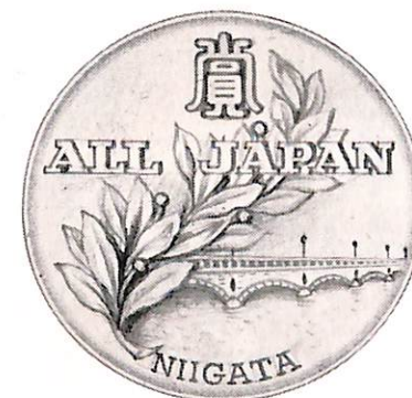
金, 銀, 銅メダル